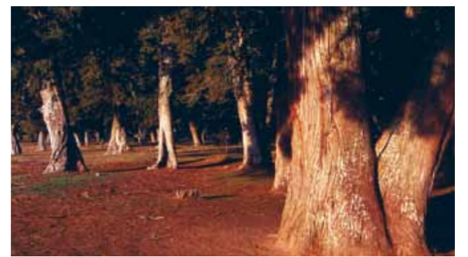
Sabinar de Calatañazor.

tran ammonites, belemnites, braquiópodos, bivalvos, crinoideos y demás fauna marina que pobló estas tierras cuando estaban cubiertas por agua, hace 200 millones de años. Cuenta con un pequeño museo etnográfico. VADILLO se caracteriza por una arquitectura bien conservada. Entre su patrimonio destaca la Iglesia de la Natividad de Nuestra Señora, situada en las afueras del pueblo sobre una loma, que fue construida a mediados del siglo XVII. Templo de grandes dimensiones que consta de tres naves con crucero, retablo barroco, pila bautismal románica y un órgano del siglo XVIII. CASAREJOS típico pueblo pinariego, con arquitectura en mampostería de cierto interés. Se conservan casas con chimeneas cónicas y entramado de adobe y madera. Balcones de madera bien labrada. Por su término discurren los ríos Lobos y Navaleno. Cabe destacar el Paraje natural de "La Laguna,