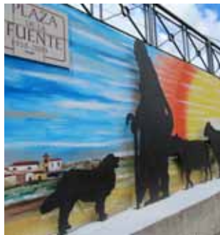
Plaza de la fuente. Almarail

Partimos de VALDESPINA pueblo rodeado de encinas, de calles y jardines bien conservados. Nos disponemos a caminar río arriba, siguiendo el GR-14 "SENDA DEL DUERO" en dirección hacia Ituero y Tardajos de Duero. Nada más abandonar Valdespina, cruzamos el puente del Canal de Almazán y a la izquierda nos encontramos la presa del antiguo Molino de La Solana (siglo XVII), ubicado en la margen contraria del río, en un paraje de belleza singular. Seguimos por el GR-14 caminando con el Duero a nuestra izquierda, Cruzamos otro puente que salva el canal y nos adentramos en el término de ALMARAIL . Seguimos caminando en paralelo al canal por el GR-14 y a aproximadamente 800 m. tomamos un desvío hacia la derecha que nos llevará hasta una antigua taina en el paraje conocido como "Majadilla". En este momento, nos aventuramos por la ladera del monte hacia arriba, hasta llegar a la ATALAYA TORRE-