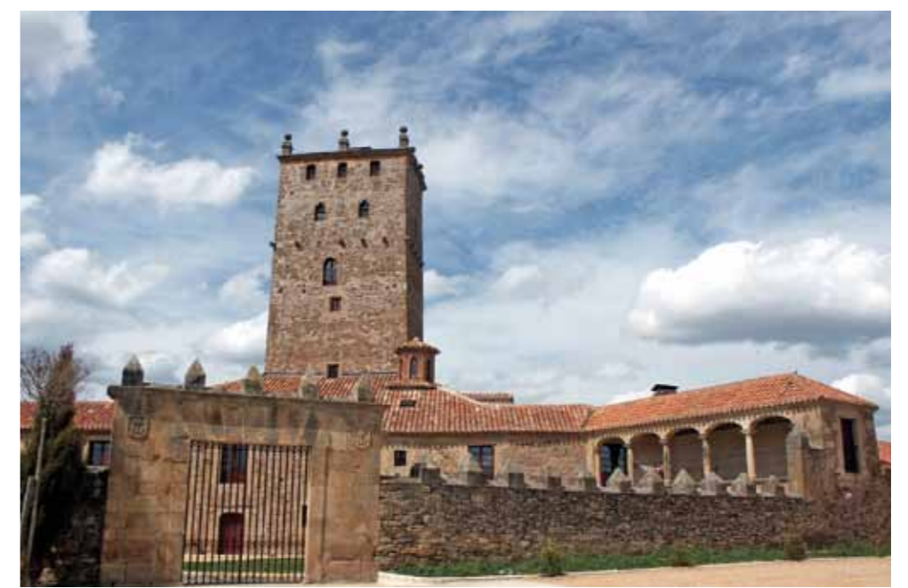
Casa Fuerte de Aldealseñor.

RENIEBLAS Nuestra Señora de la Cruz, Iglesia gótica con elementos románicos, con cementerio medieval a su alrededor, como lo denotan las estelas que sobresalen. Restos de dos palacios, uno de ellos blasonado. Restos arqueológicos importantes, por hallarse muy próxima a Numancia, campamentos romanos. Monumento dedicado al descubridor de estos yacimientos, Schultzen. ALMAJANO Iglesia de San Andrés, originalmente gótica del XVI conserva de aquella época tres tramos de la nave cubiertos con bóveda de crucería. Ermita de la Soledad. Casa fuerte de los Salcedo en la plaza Mayor, s. XVI. Varias casas blasonadas de piedra s. XVIII. SUELLACABRAS Iglesia gótica del Salvador. Ermita de la Virgen de la Blanca, y ruinas de San Capracio. Fue lugar de trashumancia y ubicación de mesteños, como lo demuestran sus casas blasonadas. Ruinas de importante casa de esquilero, con arcos, datada en 1768. Despoblado de San Román (en El Espino) y San Martín. Tradicionalmente, y debido a las ruinas allí existentes, ubican la Ciudad del Río Alhama junto al nacimiento de este río. La villa fue señorío de la Casa de Alba. Paraje conocido con el nombre