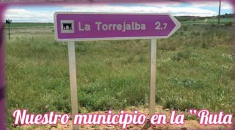
Nuestro municipio en la "Ruta del Duero"