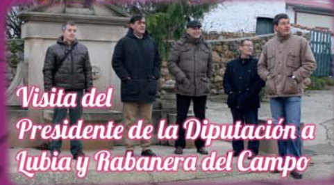
Visita del Presidente de la Diputación a Lubia y Rabanera del Campo