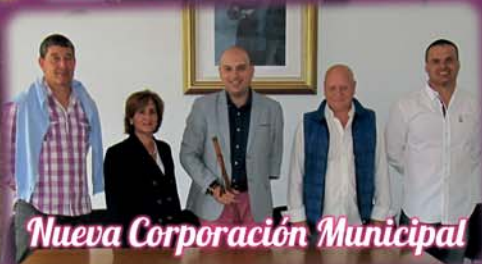
Nueva Corporación Municipal