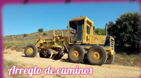
Arreglo de caminos