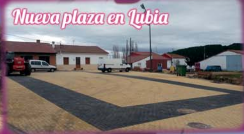
Nueva plaza en Lubia